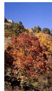
Comisión de Formación Continuada e Investigación

DIPUTACIÓN PROVINCIAL DE TERUEL COLEGIO OFICIAL DE MÉDICOS COLEGIO OFICIAL DE ENFERMERÍA ALMIRALL ASTRAZENECA GRUNENTAL JANSSEN NOVARTIS MSD SMITH-NEPHEW PFIZER