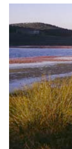
Hospital Obispo Polanco